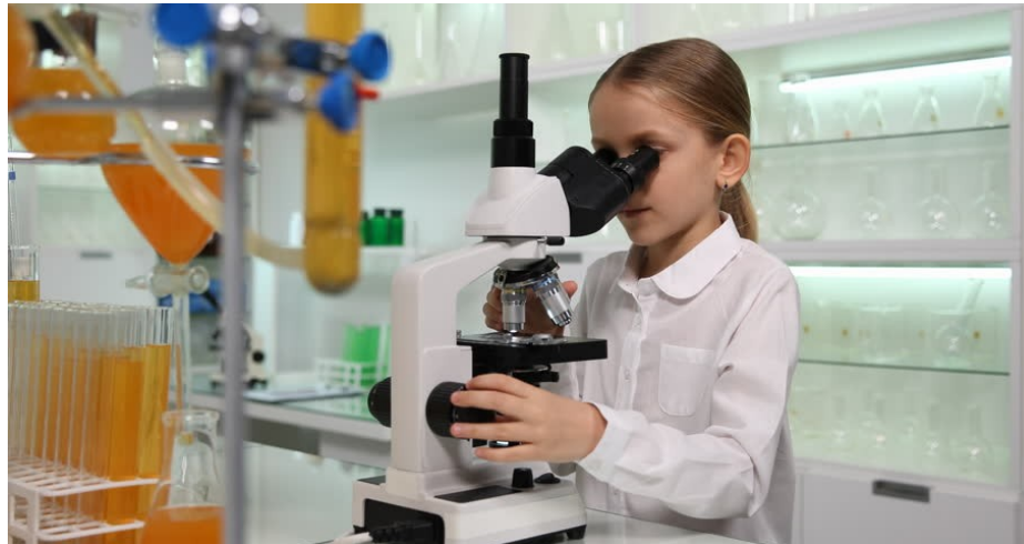
Figura professionale altamente specializzata che svolge attività di ricerca scientifica e tecnologica in enti pubblici o privati.